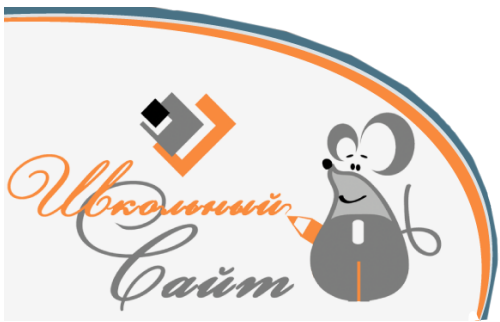
Конструктор сайтов E-Паблিশ